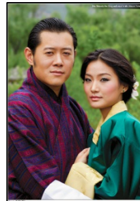
ブータン国王と王妃