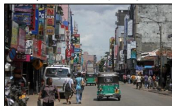
首都「スリジャヤワルダナプラコッテ」