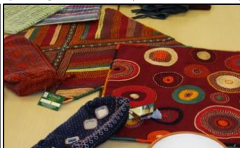
スリランカの織物