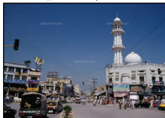
首都「イスラマバード」

面積:796,095 km 2 (日本の約2倍) 人口:184,753,300 (2010年時点、日本の約1.45倍)