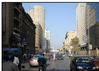
パキスタン最大のメガシティ「カラチ」