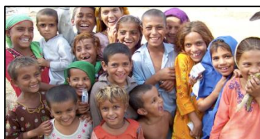
パキスタンの子どもたち